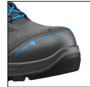
HAIX® Nano-Carbon Schutzkappe